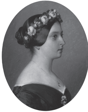
Koningin Victoria (1819-1901) regeerde over het Verenigd Koninkrijk van 1837 tot 1901. Ze was de nicht en vertrouweling van Leopold I. (Olieverf op doek, Franz Xaver Winterhalter, 1844 )

ze aan Marie Henriette duidelijk gemaakt dat er van een getrouwde vrouw enige meegaandheid werd verwacht als het de lichamelijke intimiteit met haar man betrof. Met handen en voeten had ze het uitgelegd. Marie Henriette was helaas niet onder de indruk. Waarom zou ze ook? Het kwam erop neer, zo antwoordde de hertogin, dat ze niet meegaand kon zijn in iets wat niet eens van haar verlangd werd. Met andere woorden: haar echtgenoot had geen zin in haar. Seks met zijn vrouw was een gedachte die niet in hem leefde. Dat pijnlijke feit bleef niet onbestreden. Ook Victoria's man, prins-gemaal Albert van Saksen-Coburg, de neef van Leopold I, ging zich ermee bemoeien. 'Uncle Bertie' hield spreekuur over de bloemetjes en de bijtjes. Daar had niemand hem thuis over ingelicht. Albert trachtte de negentienjarige Leo aan het verstand te brengen dat er meer inspanningen van hem verwacht werden. Ter verduidelijking van zaken nam Albert hem op sleeptouw in het nachtleven. Een bordeelbezoek, om het in duidelijke taal te zeggen. Maar wat zich in het leven nu eenmaal nooit laat afdwingen, is liefde. Hoe deskundig het Britse vorstenpaar ook zijn mocht, hun kennis van zaken kregen ze maar niet verkocht aan de Belgische zuurpruimen. Victoria meldde het aan haar oom