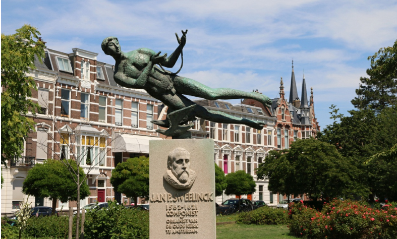
Het amandelvormige Sweelinckplein ligt in het hart van de wijk Duinoord

Van afgelegen grafelijk hof in de duinen is Den Haag een stad met internationale verbindingen geworden. Vanuit dat hof is de lijn door te trekken naar de voornamelijk villawijken en de buitenplaatsen op de strandwallen van Rijswijk en Wassenaar. Op dat voorname, internationale karakter sluit de spreuk in het Haagse gemeentewapen – Stad van Vrede en Recht – aan. Het suggereert of dit de Haagse hoofdzaak is, maar de zes routes in deze gids laten zien dat er zoveel meer is dan villa's en buitenplaatsen. Volks en multicultureel in de gerenoveerde Schilderswijk. Rafelig en vol vernieuwing in oude havengebieden. Super stads dankzij de imponerende skyline. Ongelooflijk groen in de centraal gelegen parken. Strak en ruim in de naoorlogse flatwijken. Onverwacht plattelands in de veenweiden. Dicht bij het historische Delft. Modern stedelijk in Vinexwijk Ypenburg. En dan hebben we het nog niet gehad over duin, strand en zee. Hoe glorieus de nieuwe Scheveningse boulevard, hoe weids het zicht vanaf het panoramaduin, hoe heerlijk het terras van het strandpaviljoen. Zoveel te zien, zo veel fietsplezier in Den Haag: op pad!