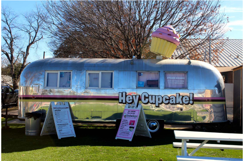
Een bekend straatbeeld in Austin: de foodtruck

Austin is gelegen in Centraal Texas, neemt zo'n 700 km 2 in beslag en telt 931.000 inwoners. Het is de hoofdstad van de staat Texas, al hebben Dallas, Houston en San Antonio meer inwoners. Daarnaast is de stad de hoofdplaats van Travis County. In dit hoofdstuk een eerste kennismaking met Austin aan de hand van de bijnamen die de stad in de loop van de jaren heeft gekregen. Dit verklaart waarom Austin zo uniek en eigen is.