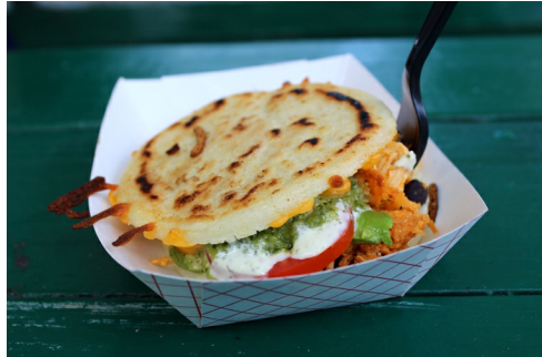
Een typische foodtruck lunch

Autobusjes vervingen het karretje. Het is onmogelijk om deze opvallende, kleurrijk beschilderde busjes over het hoofd te zien. Wel viel er op het gebied van hygiëne nog de nodige winst te behalen. Niet voor niets werden ze begin jaren '50 roach coaches, oftewel kakkerlakkbussen genoemd. Dat is verleden tijd. De foodtruck wordt inmiddels tot horeca gerekend en is aan strenge regels onderhevig.