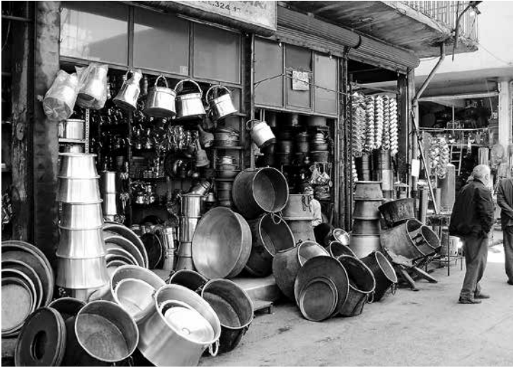
Straatbazaar in Malatya