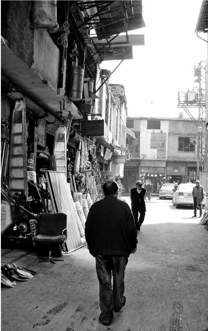
Straatbazaar in Malatya