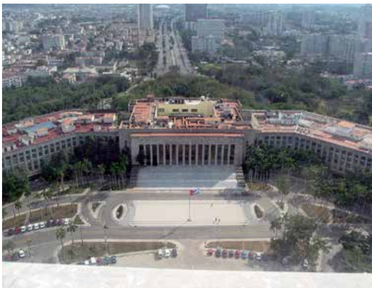
Het parlamentsgebouw aan het Plein van de Revolutie in Havana.