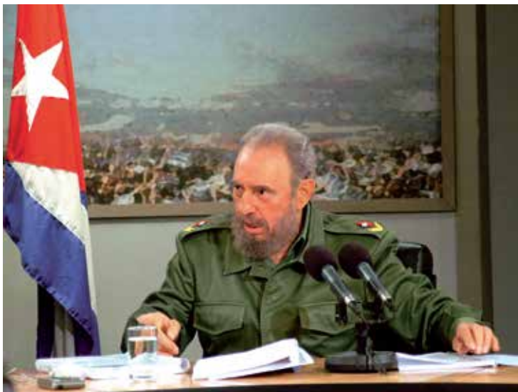
De marxistische dictator Fidel Castro was tientallen jaren alleenheerser op Cuba.