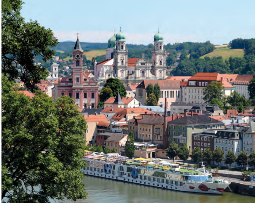
Blik op Passau en de baroktorens van de Dom