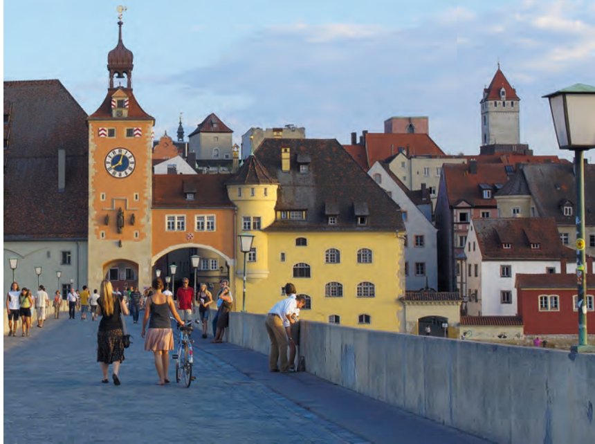
De stenen brug over de Donau en de toegang tot de Altstadt