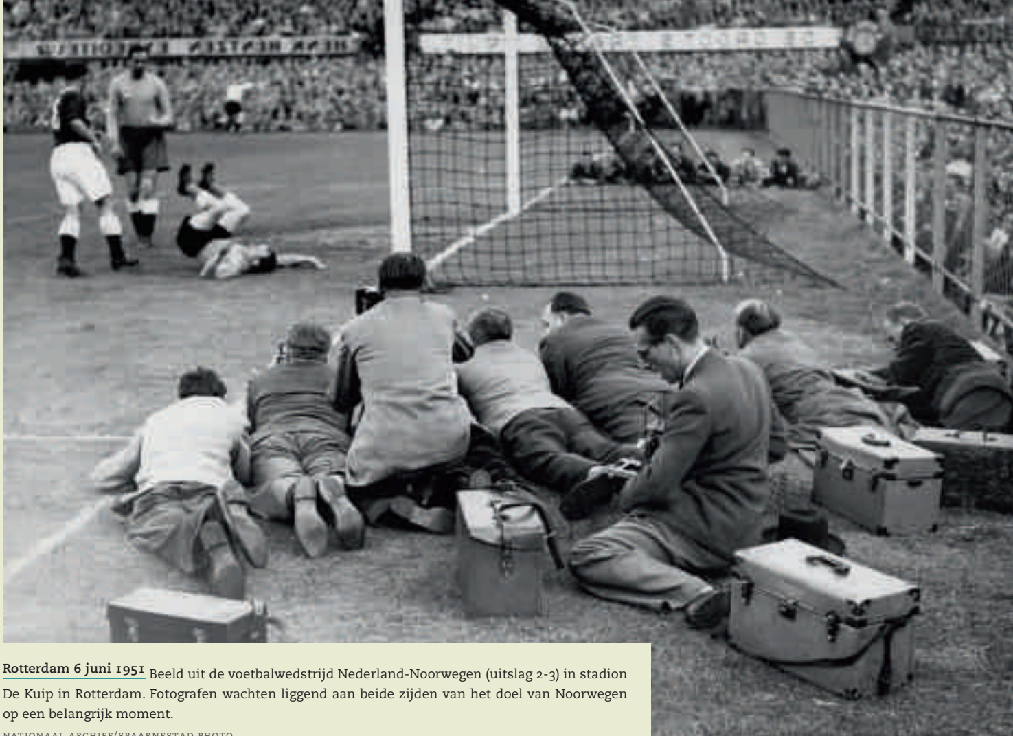
Rotterdam 6 juni 1951 Beeld uit de voetbalwedstrijd Nederland-Noorwegen (uitslag 2-3) in stadion De Kuip in Rotterdam. Fotografen wachten liggend aan beide zijden van het doel van Noorwegen op een belangrijk moment.