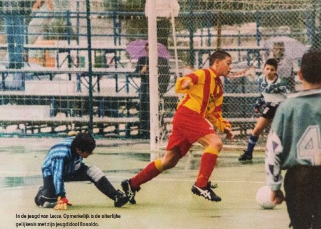
In de jeugd van Lecce. Opmerkelijk is de uiterlijke gelijkenis met zijn jeugdidool Ronaldo.