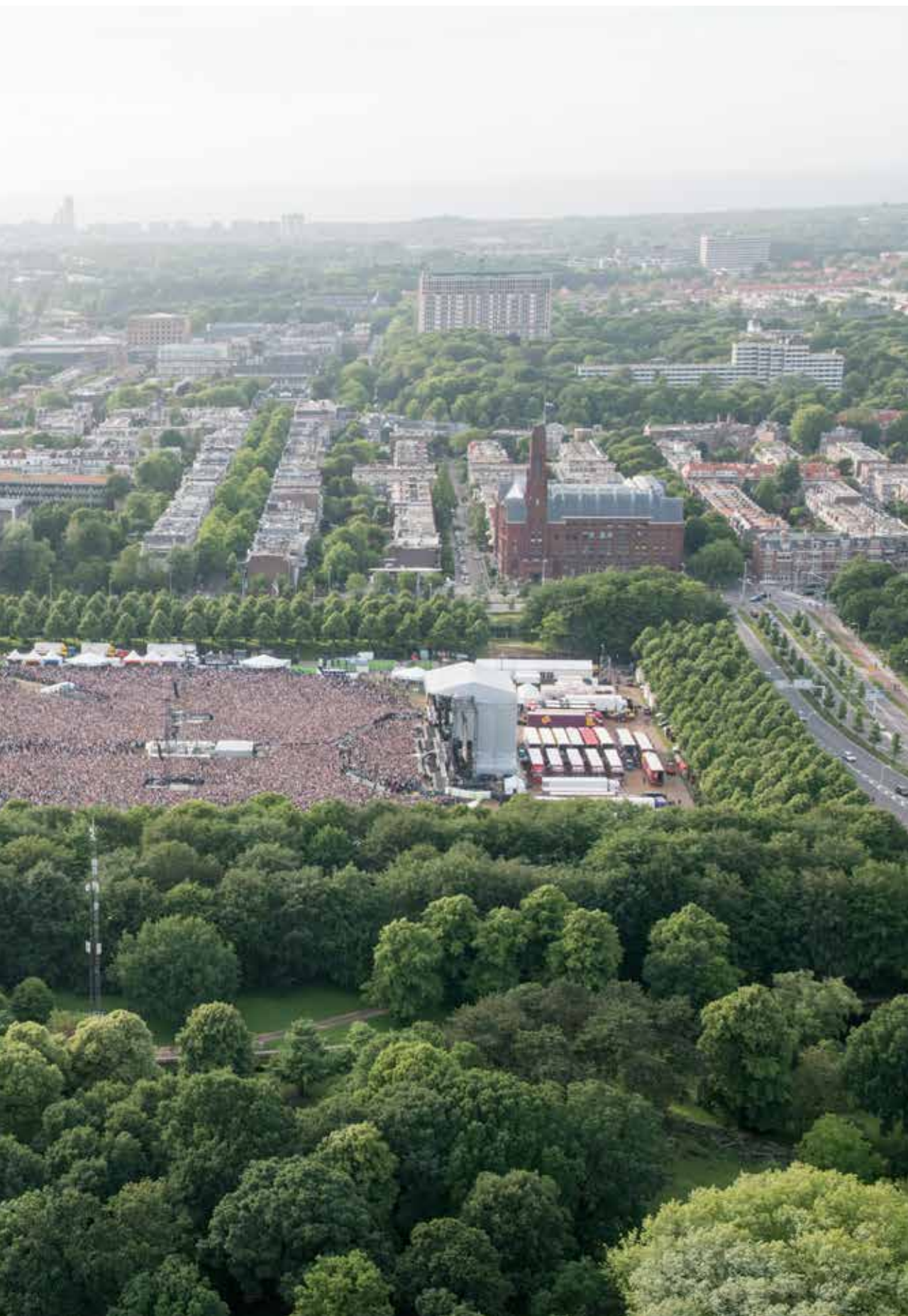
Bruce Springsteen, Malieveld 2016