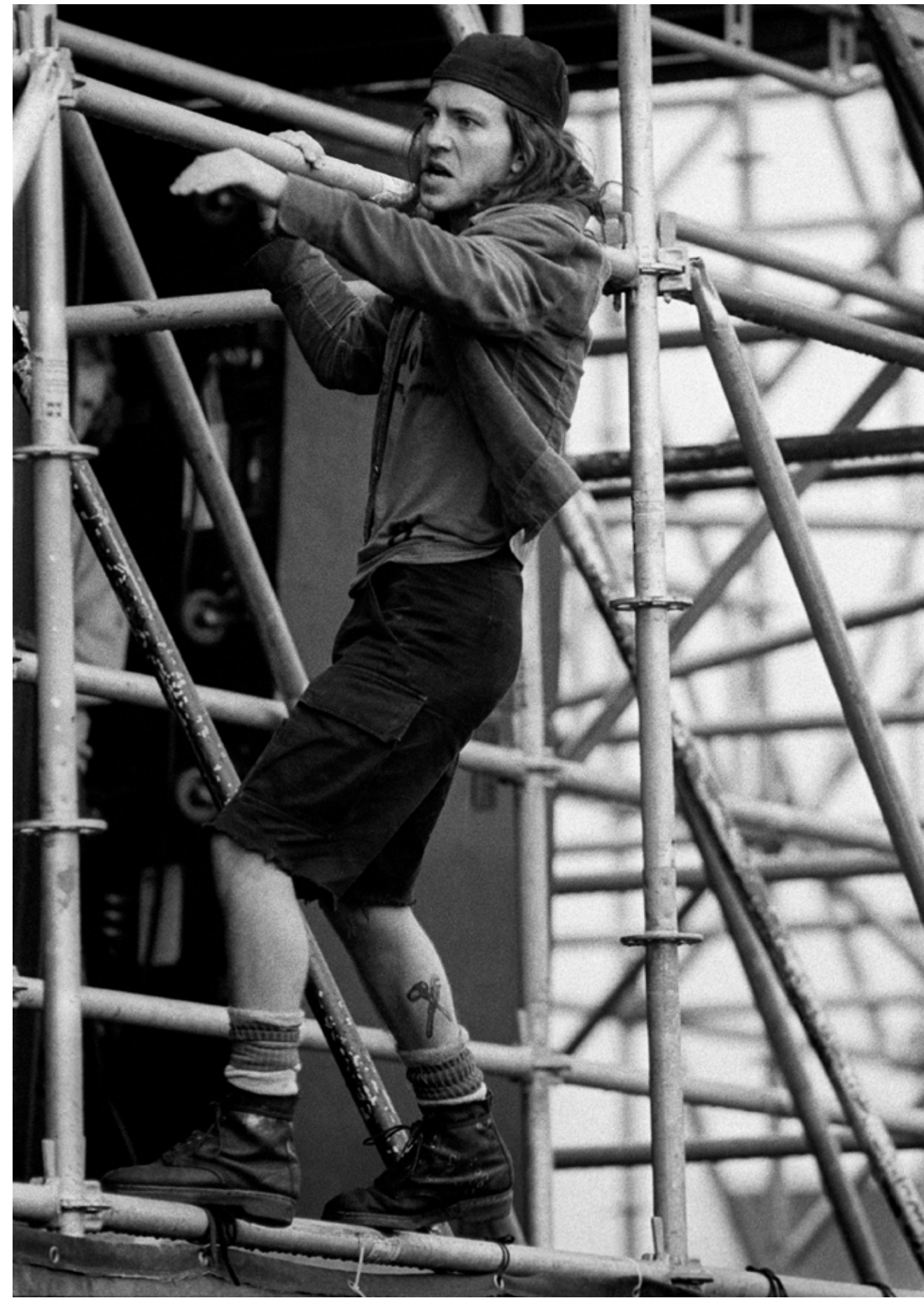
Eddie Vedder (Pearl Jam), Pinkpop 1992