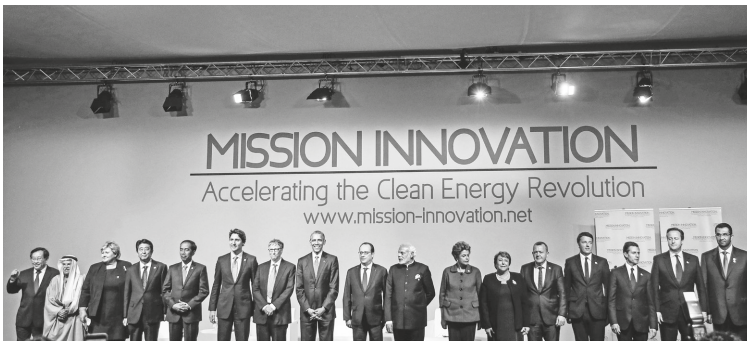
De lancering van Mission Innovation met wereldleiders op de Klimaatconferentie van Parijs in 2015 3 (zie pagina 281 voor de namen van de personen op de foto).

Ook de regeringen tastten in de buidel: in Parijs kwamen twintig staatshoofden bijeen die toezegden hun financiën voor onderzoek te verdubbelen. President Hollande, de president van de Verenigde Staten, Barack Obama, en de minister-president van India, Narendra Modi, speelden hierbij een grote rol; laatstgenoemde bedacht de naam Mission Innovation. Tegenwoordig omvat Mission Innovation 24 landen en de Europese Commissie, en is er 4,6 miljard dollar vrijgemaakt voor schone energie, een toename van meer dan 50 procent in slechts een handvol jaren.