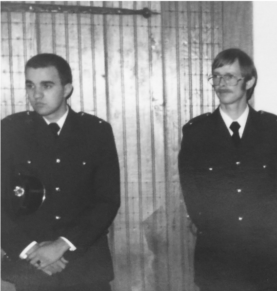
Voor het eerst in uniform als achttienjarige aspirant-agent van politie. (najaar 1981)