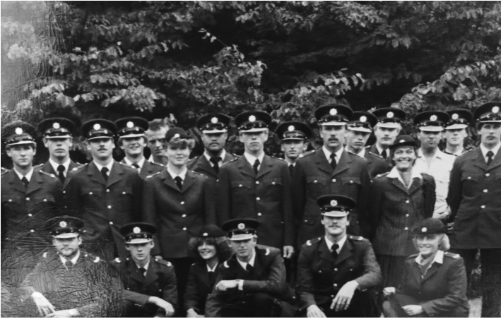
De lichte '81/3 op de dag van beëdiging op 6 augustus 1982. Als enige vergat ik mijn uniformjasje.