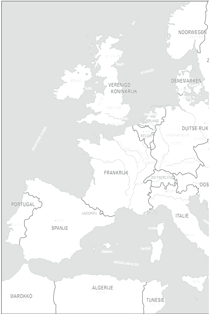
1. Europa voor de oorlog