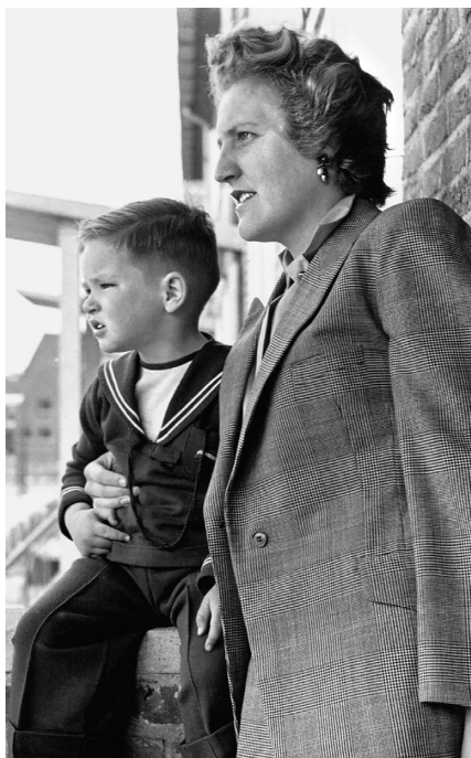
Met zijn moeder