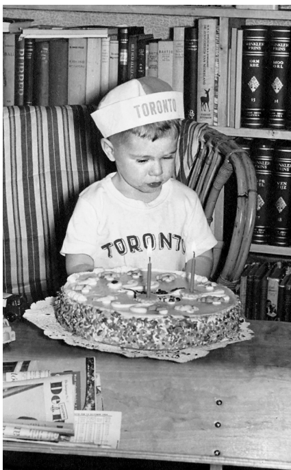
Zijn tweede verjaardag, 1954