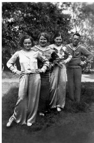
Het Rubens Dames Ensemble, 'fijne muziek, cabaret en zang'