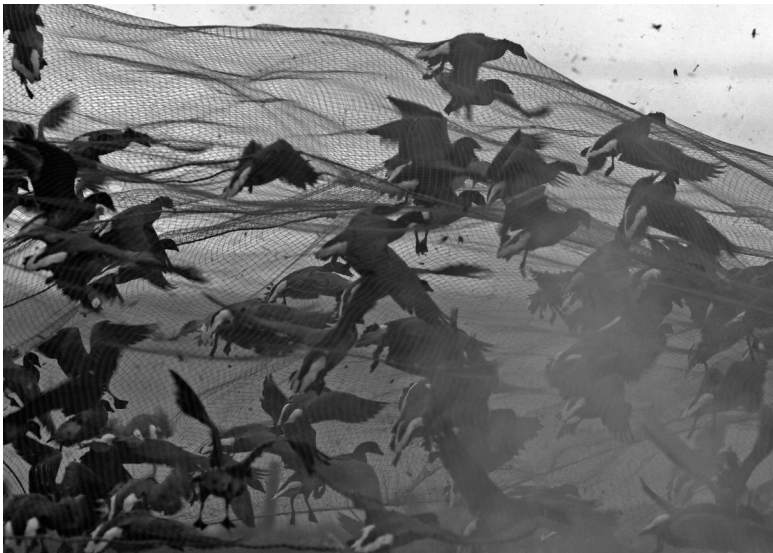
Nadat het kanonnet over de ganzen heen is geschoten, valt het naar beneden met de ganzen eronder.

Het net waarmee de rotganzen zijn gevangen is een zogenaamd kanonnet. De ganzenvangers doen dit niet voor de kost, het zijn