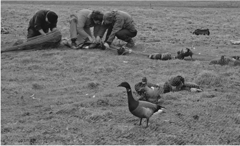
Terwijl de rotgansvangers de vogels uit het net halen, is vlak naast hen een ontsnapte mannetjesrotgans op het net geland, vlak naast zijn gevangen familieleden. Zo sterk is de familieband.

biologen anno 1976. Vijf projectielen, afgevuurd uit speciaal geconstrueerde mortieren, hebben het net over de groep ganzen heen getrokken.