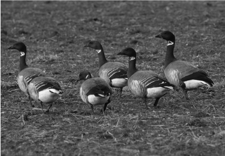
Familie rotganzen met vier jongen. De ouders zijn aan hun effen grijze rug te onderscheiden van de jongen. Rechts de vader, een derde van links de moeder. De witte eindzoompjes van de vleugeldekkeren zorgen voor de witte dwarsstrepen op de ruggen van de jongen.

nieuw vlak over het keetje heen, waarin de vangers zich schielijk hebben teruggetrokken. Rotganzen zijn bang voor mensen, en met recht. Van de keet zelf trekken de ganzen zich echter niets aan. Als er alweer een paar honderd langs de keet naar de vlakte benoorden de duintjes zijn gevlogen, draait er een groepje van elf ineens bij en valt klapwiekend in. Op de kwelder vlak voor de keet. Dat ziet er goed uit. Het zijn twee gezinnen: een paartje met vier jongen en een paartje met drie jongen. Die jongen zijn nu bijna een jaar oud, maar zijn de hele winter bij hun ouders gebleven. Aan hun vleugeldekkeren is nog te zien dat ze vorige zomer geboren zijn. Die hebben nog een smal wit randje. De ouders hebben een mooie effen grijze rug.