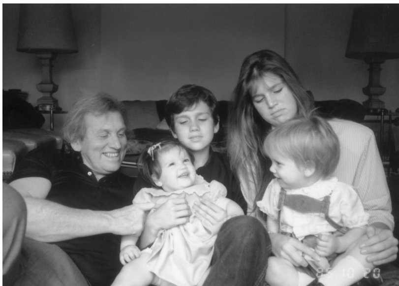
Máxima met haar vader, broers en zus in 1985

komen, dat kon alleen maar tot misverstanden leiden. Hij keek geïrriteerd naar Máxima, die zich afvroeg: wat bezielt die man?