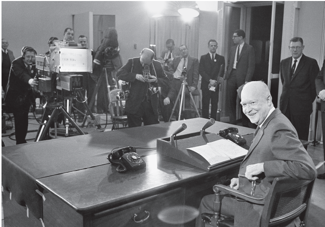
Eisenhower houdt zijn afscheidstoespraak als president, 17 januari 1961

Al was de term militair-industrieel complex nieuw, de woorden van Eisenhower deden denken aan die van George