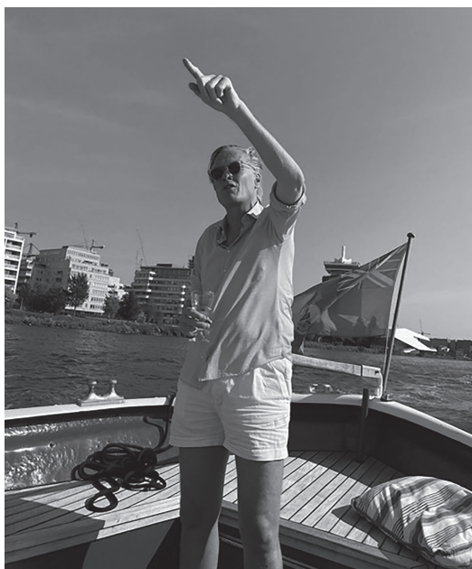
Op zomerse dagen zijn de bretels van Jort Kelder met verlof, zoals hier in 2018