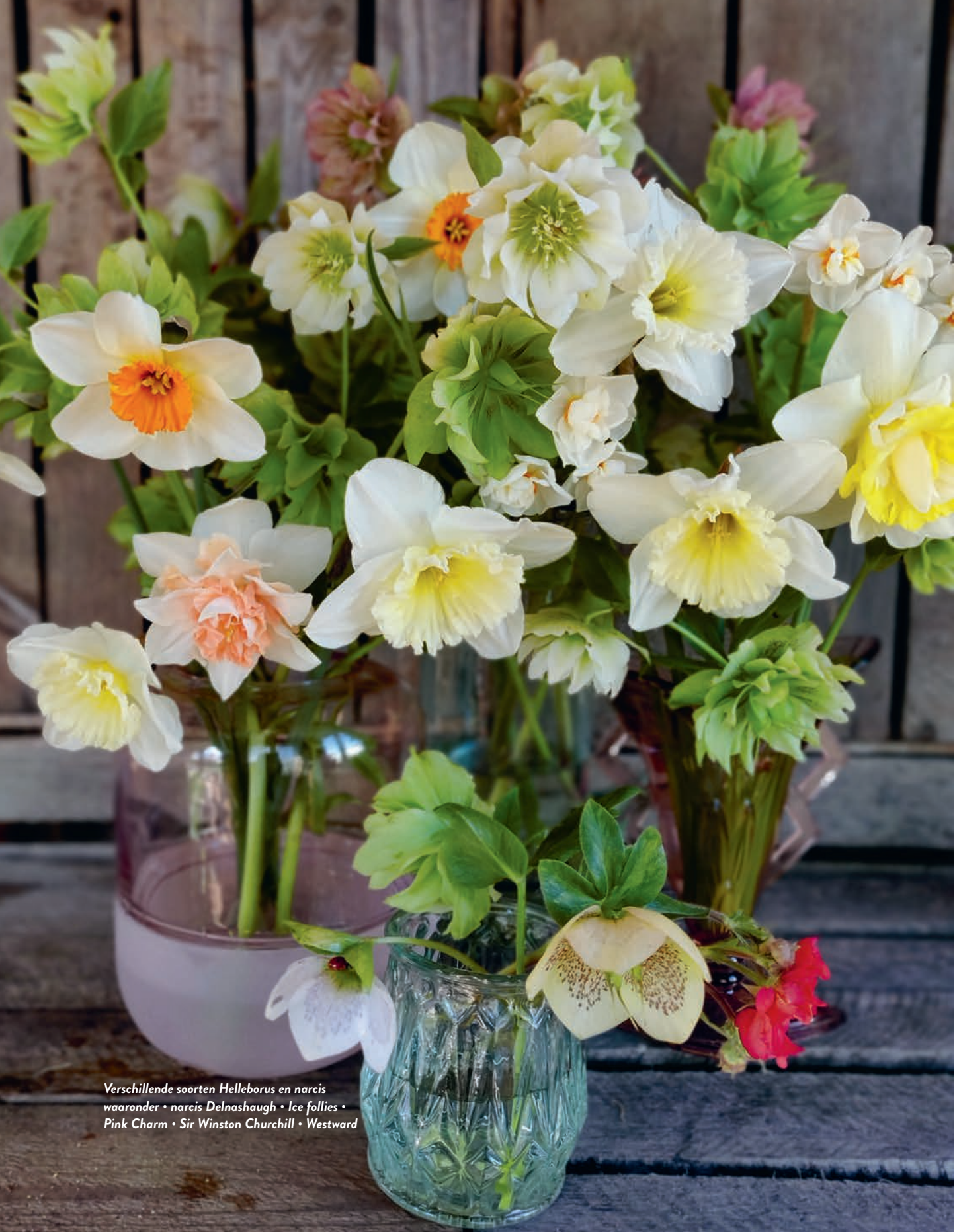
Verschillende soorten Helleborus en narcis waaronder • narcis Delnashaugh • Ice follies • Pink Charm • Sir Winston Churchill • Westward