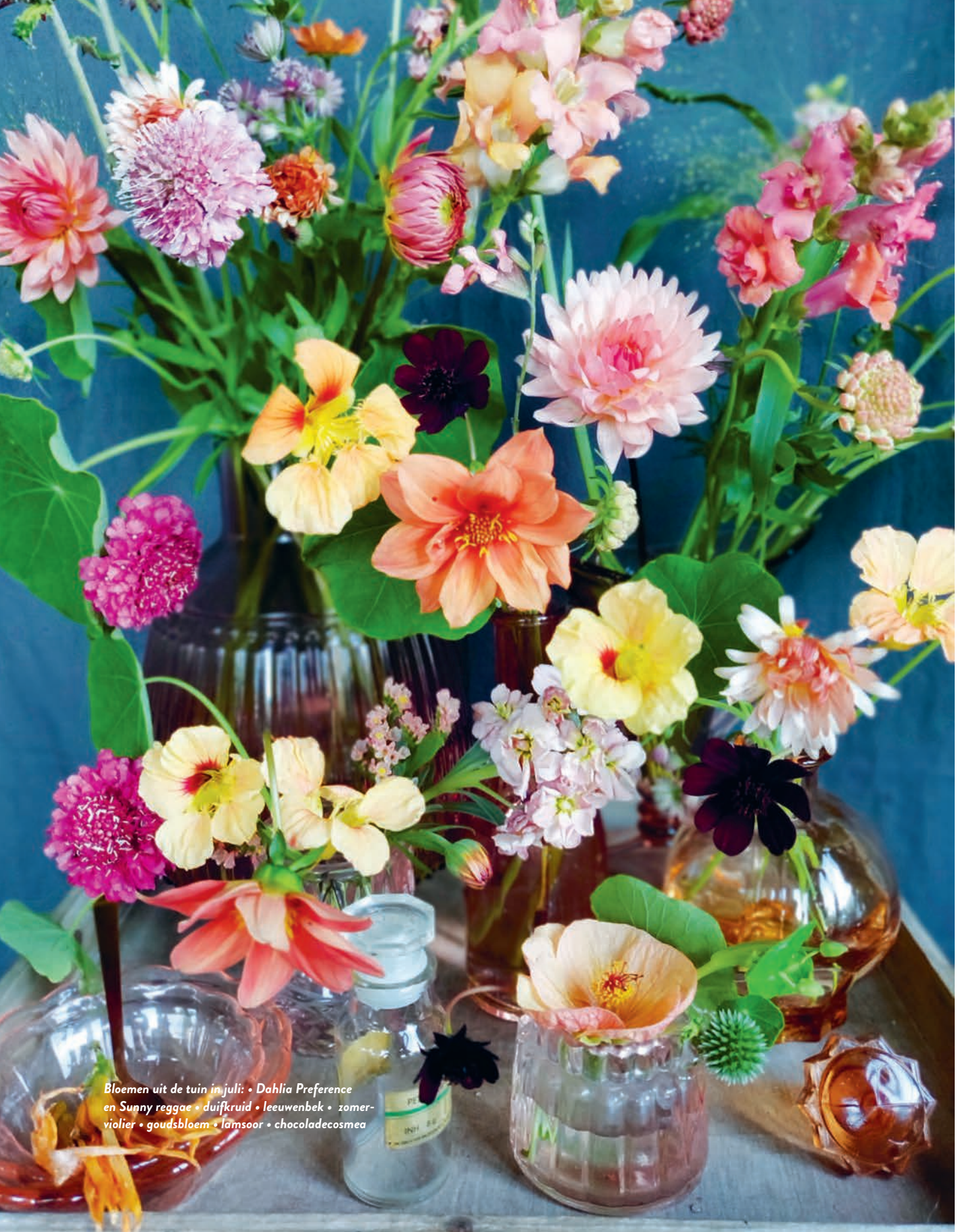
Bloemen uit de tuin in juli: • Dahlia Preference en Sunny reggae • duifkruid • leeuwenbek • zomer- violetter • goudsbloem • lamssoor • chocoladecosmea