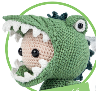
CrocoJoe pag. 66