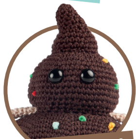
Partypooper pag. 38