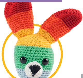
Pinata pag. 58