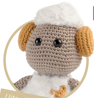
Uitsmijter pag. 55