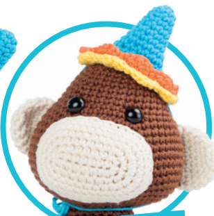
Slingeraap pag. 32