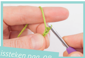
Basissteken pag. 08