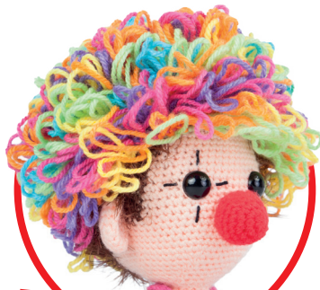
Dendennis pag. 22