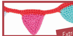
Extra's pag. 76