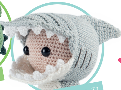
Shark-A-Jack pag. 71