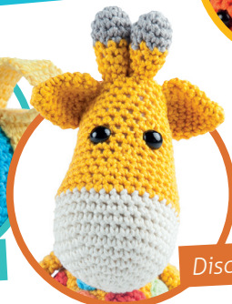
Discobal pag. 52