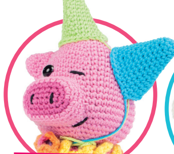
Feestvarken pag. 28