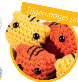
Tijgernootjes pag. 36