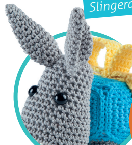
Pakezel pag. 48