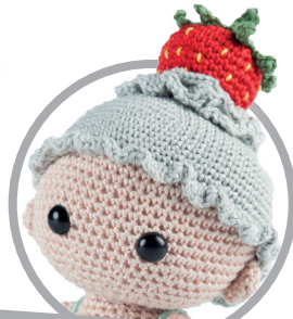
Ouwe taart pag. 62