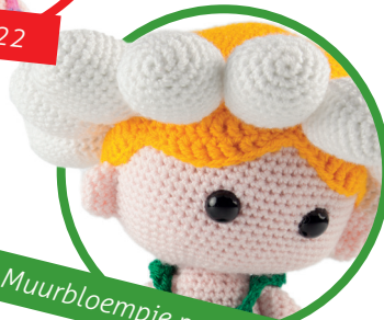
Muurbloempje pag. 44