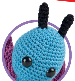
Nachtvlinder pag. 41