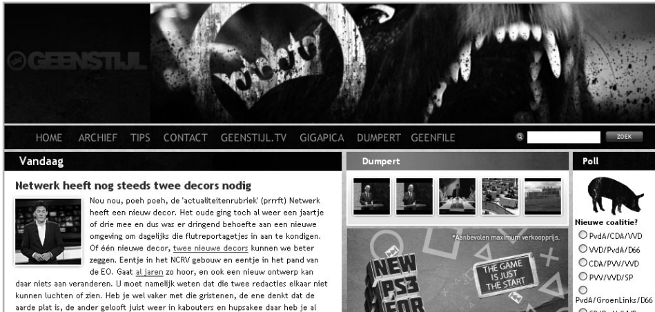
AFBEELDING 1.1 Eén van de populairste blogs in Nederland: www.geenstijl.nl .

is. Natuurlijk, je moet het even leren, en vandaar dat je er nu een boek over aan het lezen bent. Maar je hoeft geen wekenlange studie te volgen voordat je eigen weblog online is. Sterker nog, met aanbieders zoals WordPress.com, Blogger.com of Web-log.nl zet je heel snel een eigen blog in elkaar, zonder dat je ook maar enige technische kennis nodig hebt.