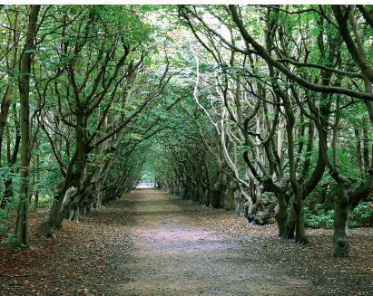
Knoestige eiken- en beukenlaan op weg naar Slot Westhove.

Achter de wonderlijke, door de zeewind platgedrukte duineikenbossen, die hier (als Europees unicum) tot vlak aan zee groeien, stichtten in de 18e eeuw patriciërs uit Middelburg hun zomerresidenties en landschapsparken. Het middeleeuwse slot Westhove werd al in 1562 door de abt van Middelburg als lustslot gebruikt.