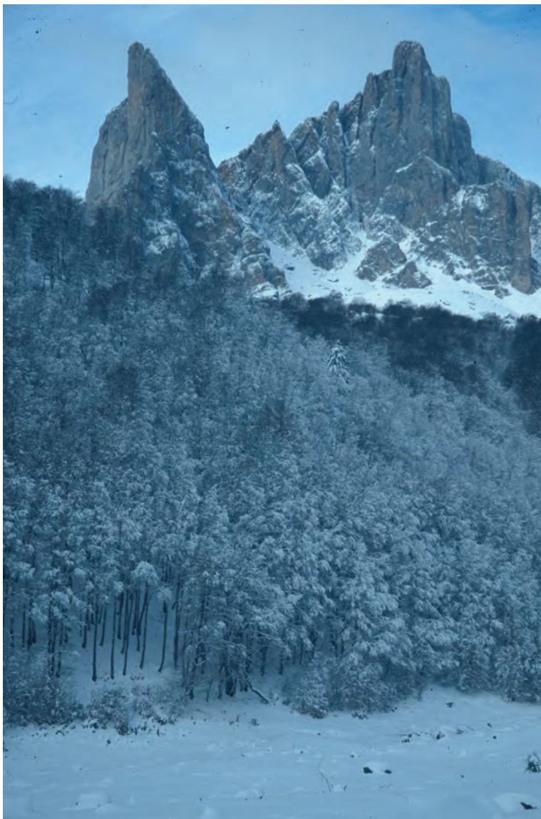
De Aiguilles d'Ansabère in de winter

leuke kerkje van Lescun: Sainte-Eulalie, dat in 2004 is voorzien van een nieuwe toren. Als u de kerk rechts laat liggen, komt u aan de oostzijde van het dorp uit bij een plek die een geweldig uitzicht biedt op Lescun en het Cirque de Lescun.