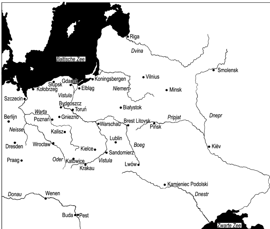
KAART 1. Steden en rivieren in en rond Polen.

Wat de Duitstalige gebieden betreft, denkt men op de eerste plaats aan Silezië ( Śląsk, Schlesien ) langsheen de Oder. Bij het begin van de Poolse geschiedenis hoorde het tot het Boheemse Přemyslidenrijk, maar het werd al door Polens eerste historische vorst, Mieszko I, veroverd. De volgende eeuwen bleef het een twistgebied tussen de twee landen, tot de Poolse koning in 1335 de Boheemse soevereiniteit erkende. Niettemin werden verscheidene plaatselijke vorstendommen nog lange tijd, soms tot in de vijftiende of zestiende eeuw, door lokale prinsen uit de Piastendynastie bestuurd. In 1526 kwam Silezië samen met Bohemen definitief in handen van de Habsburgers (de dynastie die van 1438 tot 1804 de keizers leverde van het Heilig Roomse Rijk van de Duitse natie, vanaf 1806 het Oostenrijkse keizerrijk). Van 1740 (Oostenrijkse Successieoorlog) tot na de Tweede Wereldoorlog hoorde Silezië bij Pruisen (vanaf 1871 het Duitse keizerrijk), daarop werd het weer Pools. Silezië wordt geografisch ingedeeld in het westelijke Neder-Silezië ( Śląsk Dolny met de universiteitsstad Wrocław, voorheen Breslau) en het