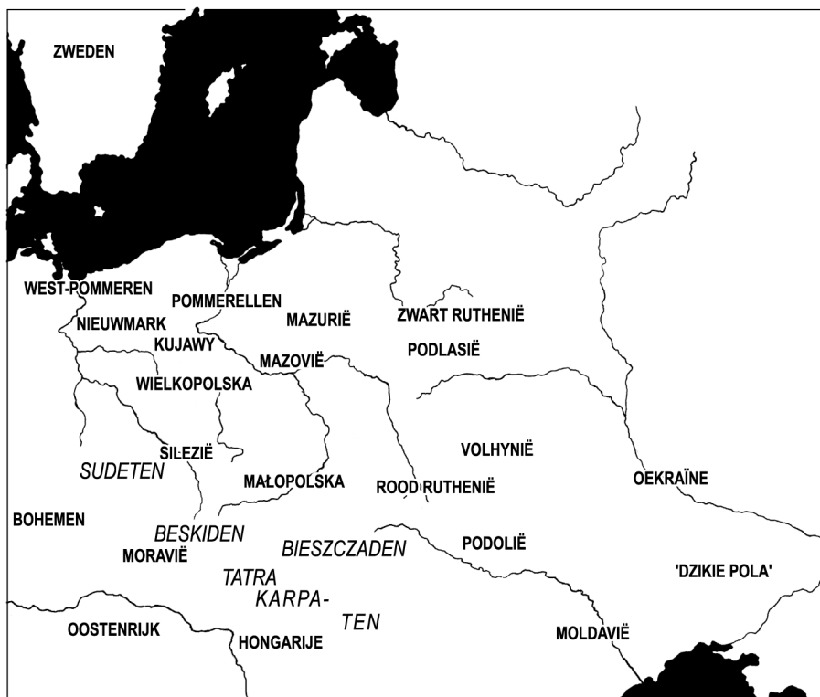
KAART 2. Regio's en bergketens in en rond Polen.

Met West-Pommeren ( Pomorze Zachodnie of Pomorze Szczecińskie ), het meest westelijke gebied rond Słupsk (Stolp), Kołobrzeg (Kolberg), Szczecin (Stettin) en westelijker, waren de Poolse banden het minst strak. Het hoorde op het einde van de tiende en het begin van de elfde eeuw en vervolgens ook nog even in het begin van de twaalfde eeuw tot het Poolse Piastenrijk. Nadien werd het snel geermaniseerd, het eerst op kerkelijk vlak. In de late Middeleeuwen was het een onafhankelijk vorstendom, om in 1521 een leen van de keizer te worden. Enkele conflicten hebben plaatsgevonden