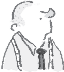
VOOR DE BEHANDELING

Vroeger had hij wel eens reclame gemaakt met zijn eigen haarbos. Hij maakte een foto van zijn prachtige kuif en zette erbij: NA DE BEHANDELING. Daarna schoor hij zijn hoofd kaal, maakte weer een foto en zette erbij: VOOR DE BEHANDELING. Het was bedrog, maar dat kon hem niet veel schelen. Als hij zijn mid-deltjes maar verkocht.