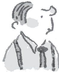
NA DE BEHANDELING

Nu keek hij naar een magisch flesje. Een wonder-middel dat hem beroemd kon maken. Misschien kreeg hij er wel de Nobelprijs voor.