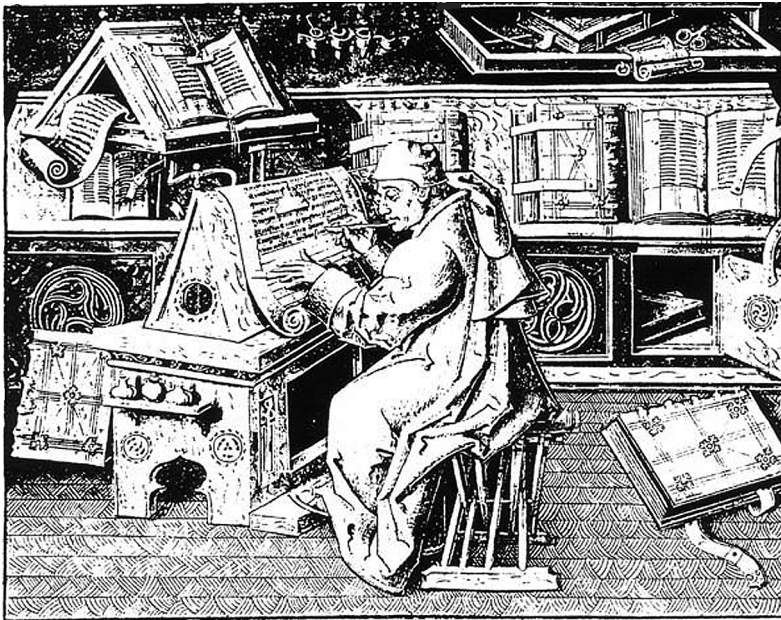
Middeleeuwse schrijver werkend aan een compilatie

Wat betreft de situatie vóór de uitvinding van de boekdrukkunst zijn de productieomstandigheden van middeleeuwse boeken bijzonder leerzaam. Een kopiïst in Parijs had over het algemeen een dag nodig voor het afschrijven van twee pagina's (of vier kolommen). Dat betekende dat het ongeveer vier maanden duurde om een dik boekwerk te kopiëren. Boekenprijzen varieerden enorm, afhankelijk van het manuscript. Het duurste waren de rijk