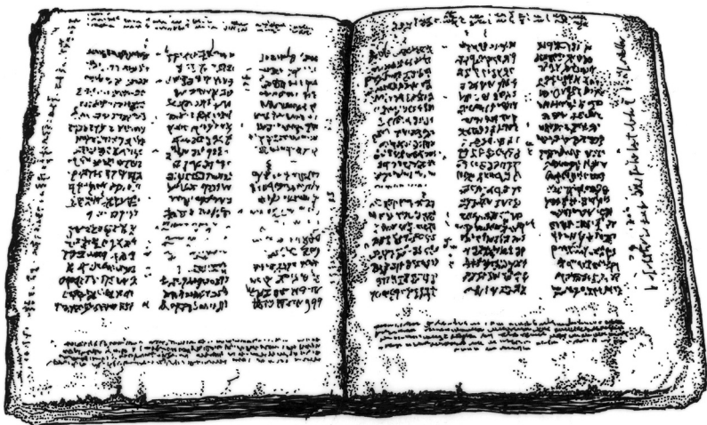
Een boekrol en een codex