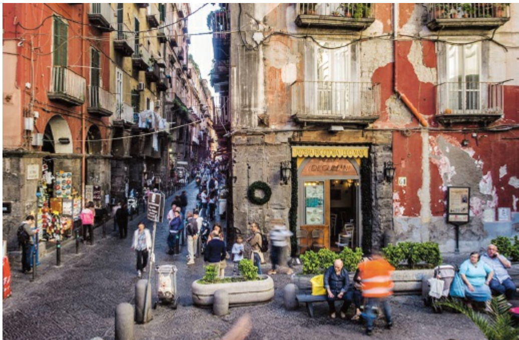
Napels leeft van tegenstellingen – en van de vriendelijkheid van zijn inwoners.

Het havengebied zal de komende jaren veranderen in een moderne foyer aan de zeezijde van de stad. De majestueuze Neptunusfontein voor het stadhuis aan de Piazza Municipio doet al vermoeden dat de promenade naar zee in de toekomst wel eens een stedenbouwkundig paradepaardje zou kunnen worden. Recht onder het plein wordt bovendien gewerkt aan een deel van Napels' grootste uitdaging: de metro wordt samen met het overige openbaar vervoer stapsgewijs gemoderniseerd en geëcologiseerd. Er rijden al milieuvriendelijke bussen, het huren van elektrische auto's wordt gepromoot en ieder jaar troggelen de planologen het verkeer een nieuwe voetgangerszone af. Napels heeft tegenwoordig zelfs een fietspad langs de Lungomare; de opening ervan betekende een verkeerskundige revolutie. De uitbreiding van het metronet, een race tegen het voortdurend dreigende chronische verkeersinfarct, nadert langzaam haar einde, hoewel het werk steeds weer stagneert als men ondergronds weer op resten van het Neapolis uit de oudheid stuit.