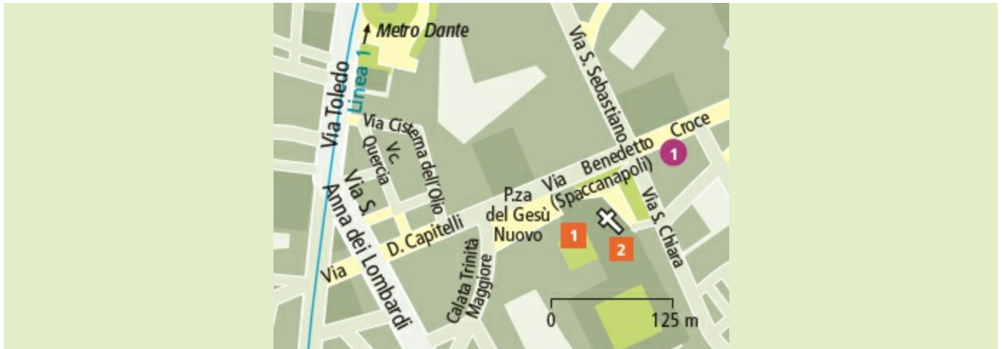
Uitneembare kaart F/G 3 | Metro: Dante