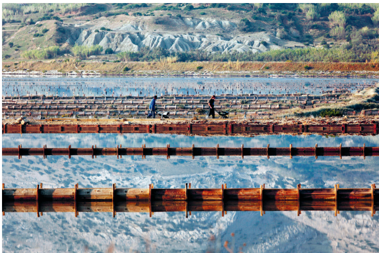
Waarschijnlijk wordt op Pag al tweeduizend jaar zout gewonnen – en deze bodemschat was de reden dat Venetië het eiland opeiste. Tegenwoordig is de zoutpan van Solana Pag steeds meer een toeristische attractie.

(info: www.zrce.eu ). Dit beroemde strand ligt weliswaar een paar kilometer buiten het mooie stadje, maar dat lijkt er wel onder. In juli en augustus blijven de gewone toeristen liever weg omdat de bassen dan dag en nacht dreunen. Het einde lijkt inmiddels zoek ... En dat terwijl de stranden echt aantrekkelijk zijn, en onder het stadsmuseum Gradski muzej (Ul. kralja Zvonimira 27, tel. 053 66 11 60, http://muzej.novalja.hr , juni-sept. ma.-za. 9-13, 18-22, daarbuiten ma.-vr. 9-13 uur, Kn 15) ligt iets spectaculairs verstopt: het einde van een onderaards Romeins aquaduct, dat het water van een 1200 m verderop gelegen bron onder de heuvel door leidt. De waterloop is manshoog en heeft een verval van 7 cm op 1000 m. Je mag er helaas niet in, maar alleen al een blik op de gang is indrukwekkend genoeg.