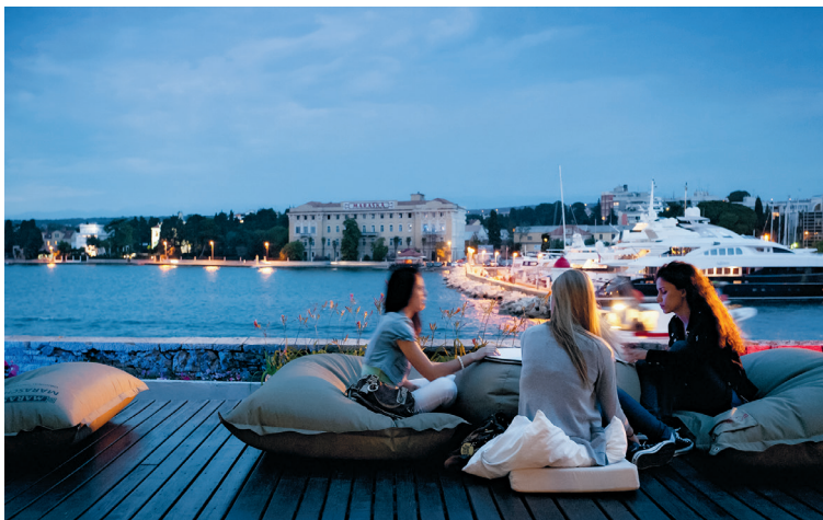
Nonchalant relaxen – eerst de historische binnenstad van Zadar bezichtigen, daarna heerlijk ontspannen met uitzicht op de nieuwe stad.