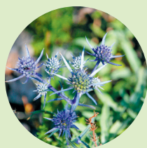
Langs het pad bloeit ook de kruisdistel.

derop kom je bij de splitsing naar de grot . Hier beginnen de haarspeldbochten naar de 570 m hooggelegen ingang van Manita peč 1. Vlak daarvoor kun je omhoog naar een geweldig uitzichtpunt! Een laatste blik op hemel en zon, daarna ga je de onderwereld in (circa 1,5 uur).