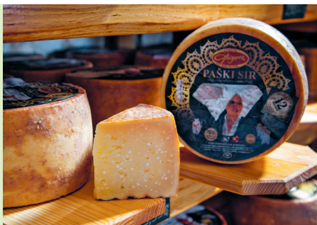
Onlosmakelijk verbonden met Pag, net zoals de natuurstenen muurtjes en het zout: Paški sir.

toegevoegd en de melk wordt verhit. Vervolgens neemt men de daaruit voortvloeiende wrongel, snijdt hem in stukken, verhit hem opnieuw om de wei eraan te onttrekken en laat hem drogen. Onder hoge druk wordt de wrongel geperst en ten slotte 24 uur in een zoutbad gelegd. Na nog een dag drogen gaat de kaas naar een rijpingskamer met een temperatuur van 17 °C. Kaas van Pag rijpt minstens drie maanden en wordt dagelijks gedraaid. Zijn volle smaak verkrijgt de kaas na een rijpingsperiode van minimaal zes maanden