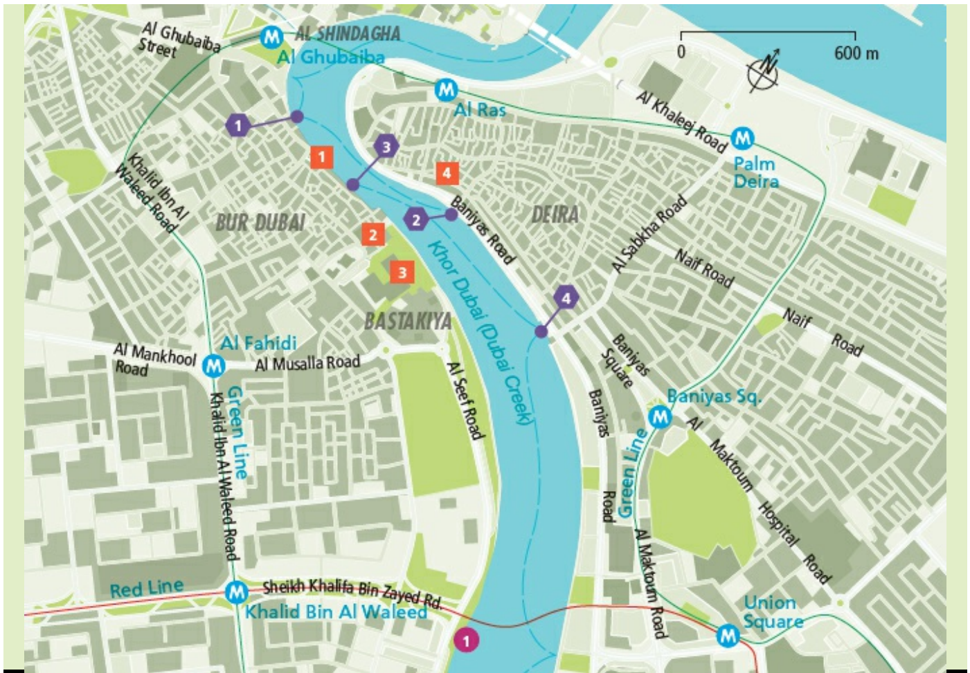
Uitneembare kaart 2, V 4-6 | Metro Green Line, station Al Ghubaiba