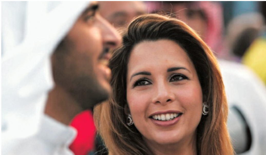
Sjeik Mohammed en zijn vrouw sjeika Haya Bint Hoessein zijn in het emiraat voorbeelden van een tolerante islam.

Een rechter of geestelijke sluit het huwelijk met een verdrag af. De ceremonie vindt traditioneel plaats in de familiewoning van de bruid. Daarna beginnen de voorbereidingen voor het grote feest, waarvan op de vooravond het huwelijk formeel wordt gesloten. Ook op het huwelijksfeest heerst een strenge scheiding van de seksen. Er is een enorm feest van de bruid, waaraan alleen vrouwen deelnemen, en een van de bruidegom voor de mannelijke gasten. Traditioneel brengt het huwelijkspaar de huwelijksnacht door in het huis van de ouders van de bruid, waarna ze de volgende dag in het huis van de familie van de bruidegom trekken. Hotels in Dubai bieden speciale arrangementen voor bruiloften en bruiloftsnachten.