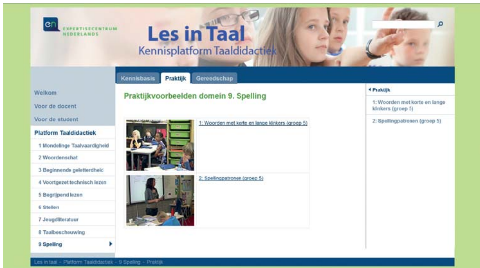
FIGUUR 1.3 De website Les in taal , waarop een koppeling wordt gemaakt tussen de kennisbasis en praktijkvoorbeelden