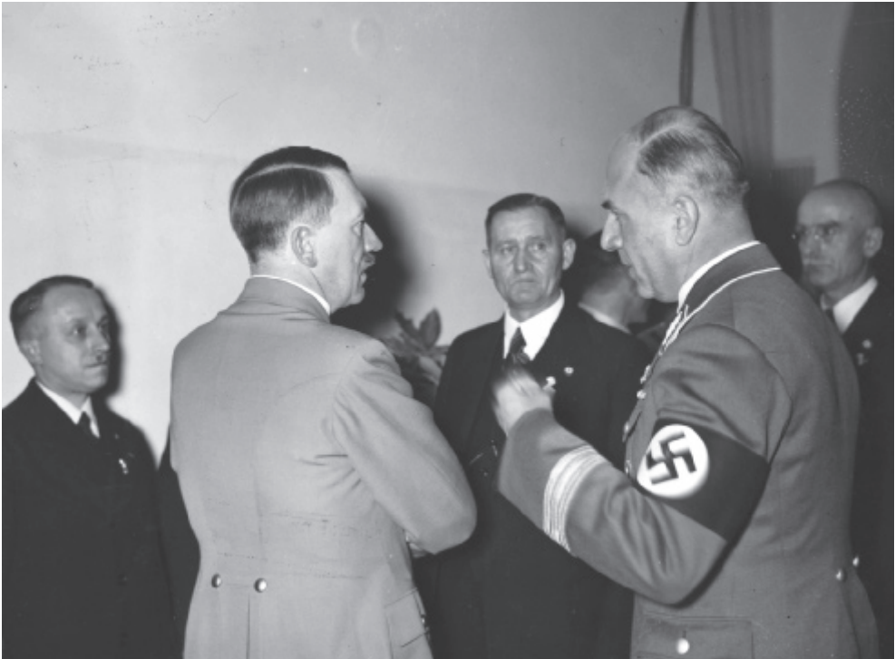
Berlijn, 18 december 1940. Hitler in gesprek met zijn minister van Bewapening en Munitie, Fritz Todt.

snel na de val van Nederlands-Indië aan het bizarre idee om Afrikaanse kolonies te veroveren met KNIL-troepen, die met dat doel door de Japanners vrijgelaten moesten worden. Het kwam de Duitse bezetters ter ore en gaf ze des te meer reden om te twijfelen aan het nut dat deze fantast voor hen zou kunnen hebben.