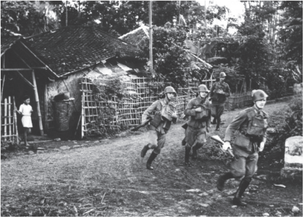
Java, Nederlands-Indië, 1941. Manschappen van het Koninklijk Nederlandsch-Indisch Leger (KNIL) doorkruisen een kampong tijdens een oefening.

tere opdracht stond. Nederlands-Indië moest zich zelfstandig leren verdedigen tegen een dreigende invasie. Dat betekende het leger versterken en een eigen wapenindustrie opzetten.