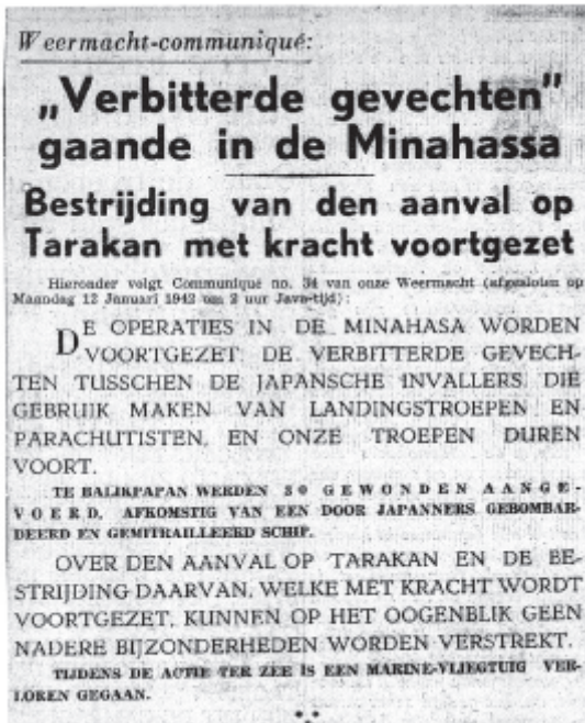
Bericht over de Japanse aanval op Nederlands-Indië in De Indische Courant van dinsdag 13 januari 1942.

rij van het eiland. Zij zien Japanse mijnenvegers naderen, die de rivier naar het plaatsje Tarakan alvast doorvaarbaar willen maken. De kustbatterij opent het vuur. Twee mijnenvegers gaan naar de bodem. Ook op de drenkelingen wordt geschoten. De Japanse legercommandant is woedend en eist genoegdoening. Met de Japanse belofte dat ze niet hard gestraft zullen worden, overtuigt De Waal de 215 mannen om zich krijgsgevangenen te laten maken. Twee weken later worden ze geboeid in zee geworpen, op de plek waar de mijnenvegers zijn gezonken.