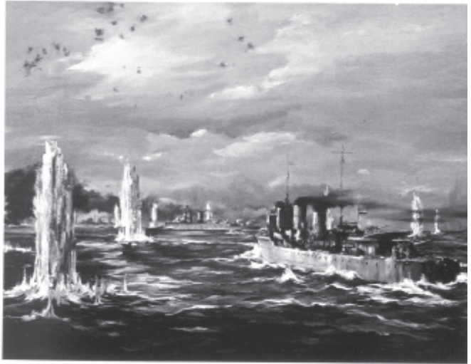
De slag in de Javazee, 27 februari 1942, geschilderd door J.P.H. Brouwer (1970), naar een tekening van Japanse vliegers uit R.21 J. Kawan, commandant van de torpedobootjager Kortenaer (rechts op de voorgrond) (Het Atelier, Maritiemuseum).

Slag in de Javazee, 27 februari 1942. Weergegeven in dit olieverfschilderij uit 1970 is de situatie onmiddellijk na de treffer op H.M.S. Exeter (uiterst links) waardoor dat schip de formatie moest verlaten. Op de voorgrond rechts torpedobootjager Hr.Ms. Kortenaer, kort voordat dit schip getroffen zou worden door een Japanse torpedo. In het midden vaart de kruiser Hr.Ms. Java, vuur afgevend op de Japanse vloot.