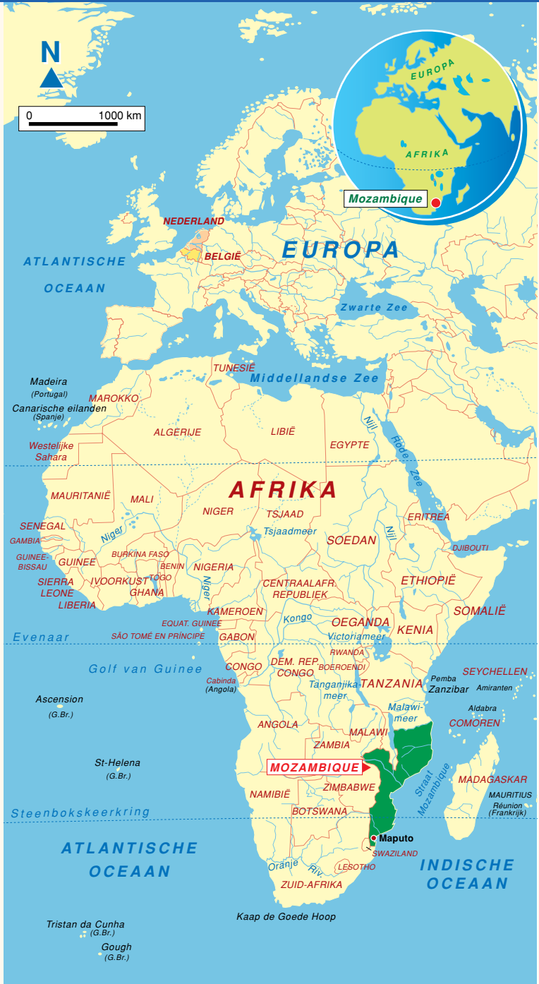
MOZAMBIQUE, LIGGING IN AFRIKA