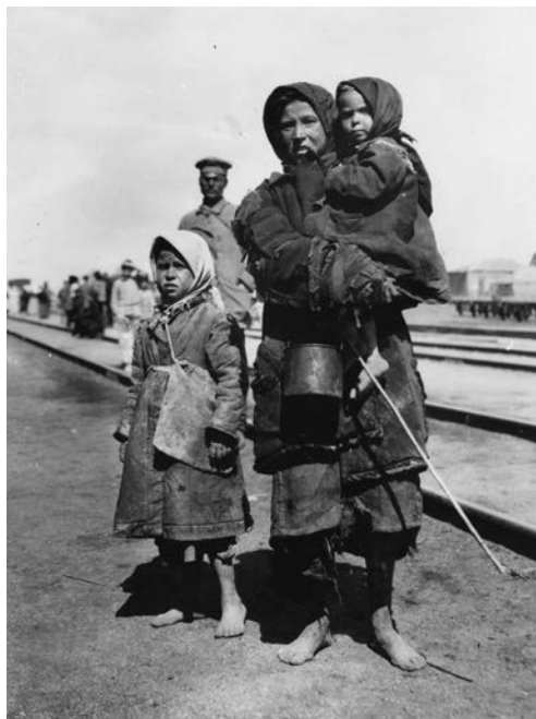
Een vluchtelingengezin op zoek naar eten

bergen moet met gifgas worden gezuiverd. Er moeten zorgvuldige berekeningen worden gemaakt om ervoor te zorgen dat een wolk verstikend gas zich door het bos verspreidt en alles verdelgt wat zich daar schuilhoudt.’